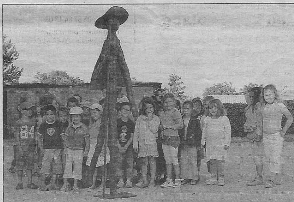
Les enfants et le pèlerin.

L'artiste précise : « L'art ouvre les chemins du mental pour la vie personnelle comme professionnelle, il faut donc un déclencheur, les rencontres artistes écoliers voire adultes devraient se développer plus intensivement. »